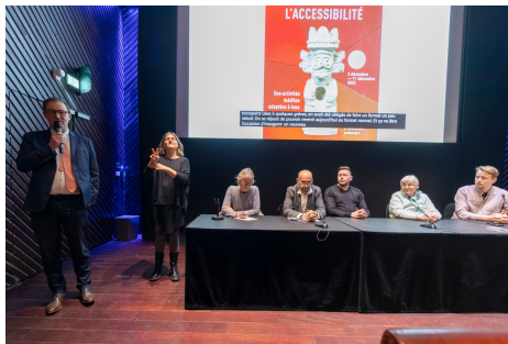
Semaine de l'accessibilité 2022, musée du quai Branly – Jacques Chirac.

Nous avons le plaisir de vous informer que vous recevrez régulièrement une lettre d'information sur nos actions. Nous sommes à votre disposition pour tout commentaire à cette adresse mail : ath.asschloe@gmail.com