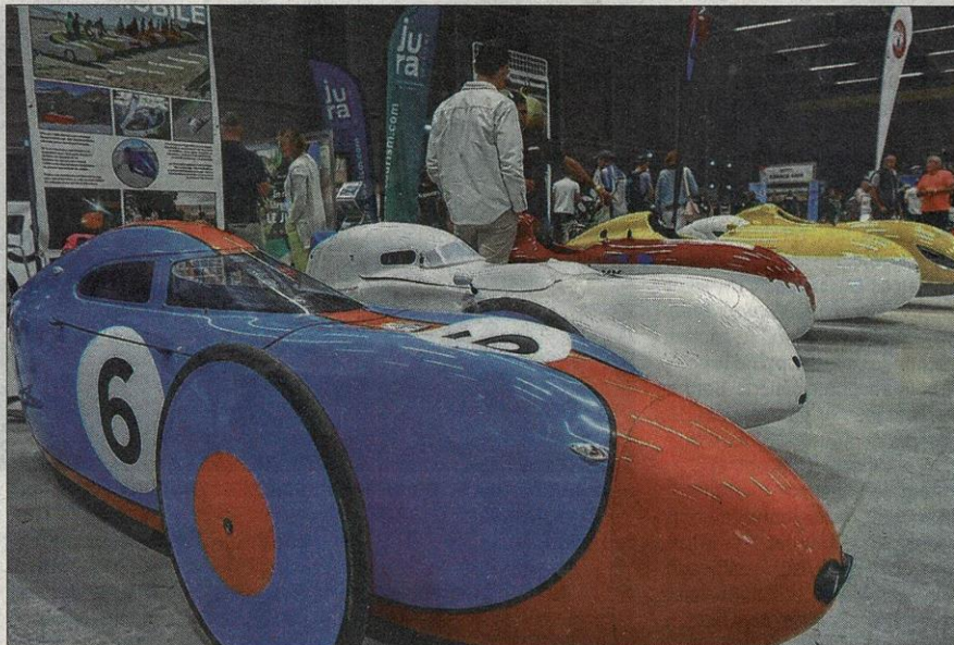
Du plus classique au plus étrange, des vélos de toutes sortes (comme ici ceux des cycles JV & Fenioux) sont présentés jusqu'à dimanche au Parc des expositions du Wacken.

Avis aux amateurs : on peut l'essayer, comme l'ensemble de la gamme – qui va jusqu'au vélo 20 pouces – sur deux circuits dédiés situés au fond du hall d'exposition ; même les casques et les coachs sont fournis !